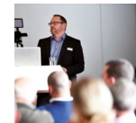
Impressionen Branchentalk Tourismus 2018