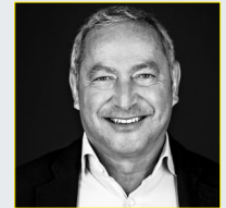
Samih Sawiris Präsident Orascom Development Holding